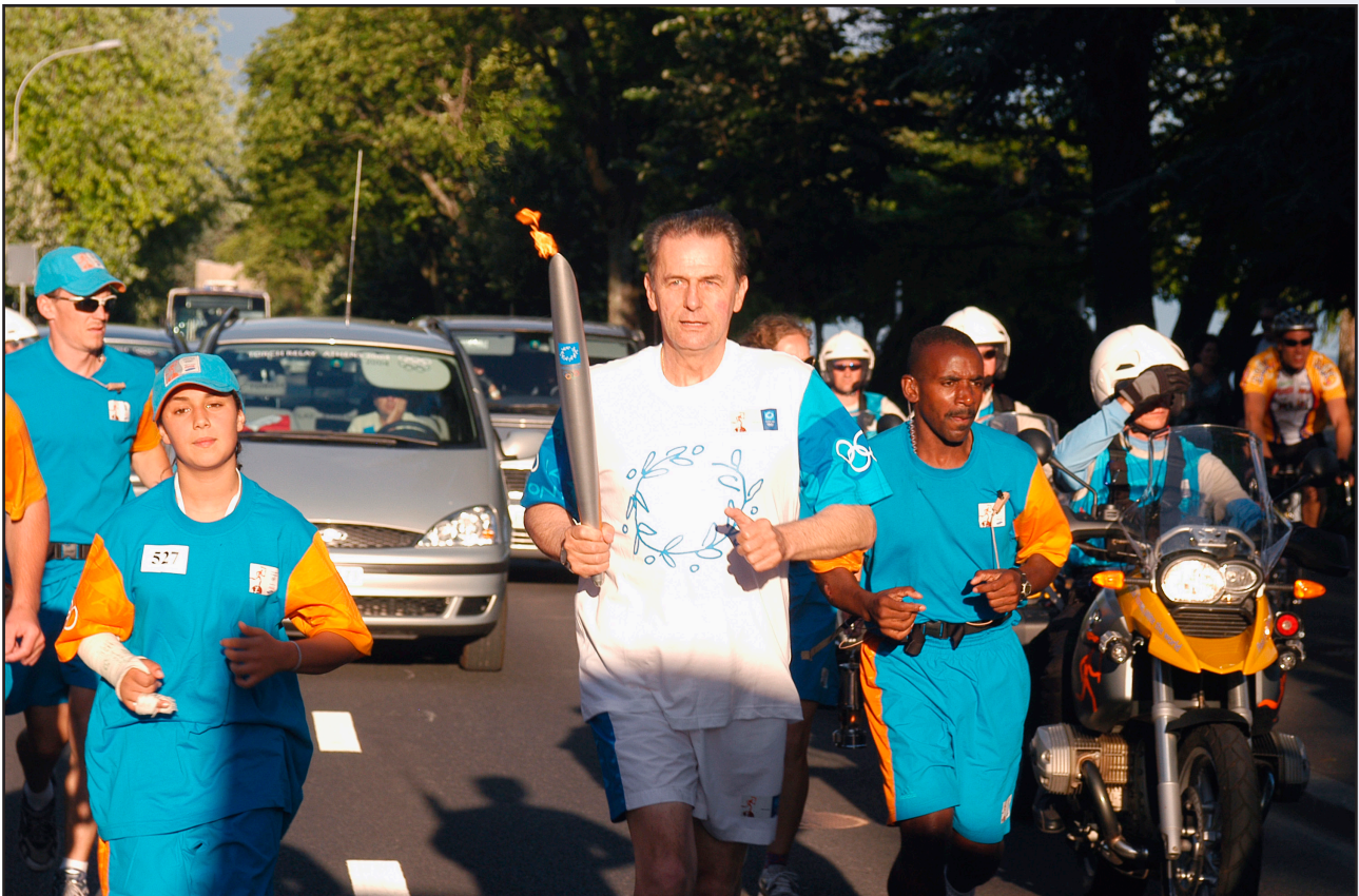
Internationaal Olympisch Comité 2004. Alle rechten voorbehouden.

“Sport is een krachtig middel voor opvoeding, vrede en ontwikkeling.”